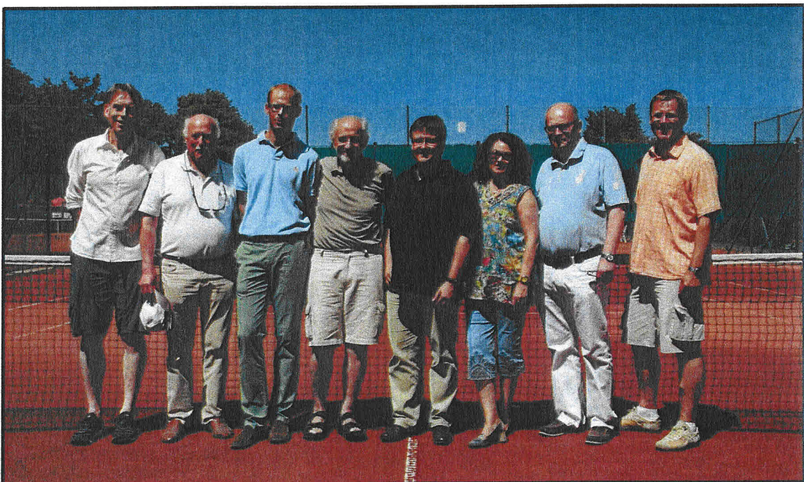
Ehrengäste mit Spartenleitung