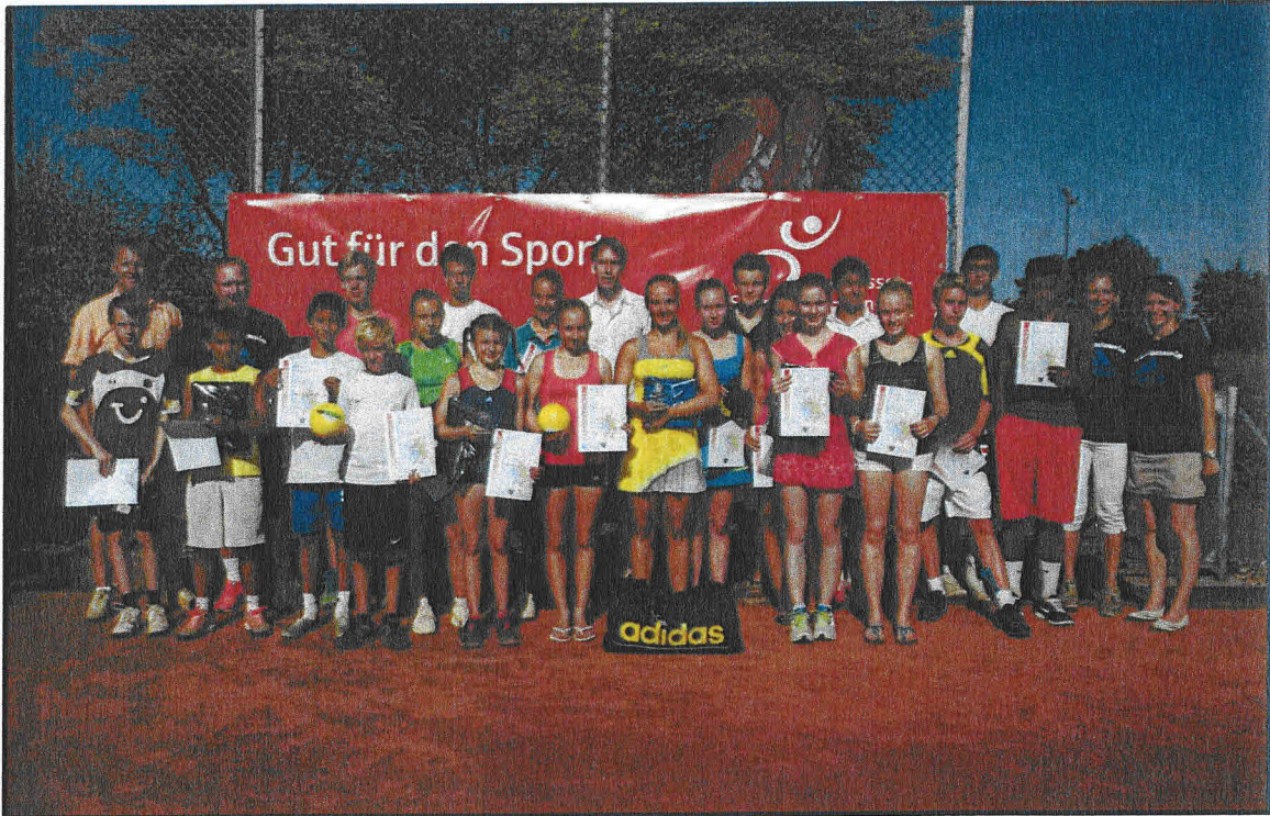
Sieger, Platzierte und Offizielle